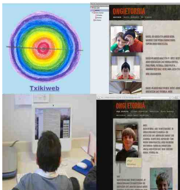
Imagen 1: Txiki-Web

La Txiki-Web es una de las actividades que se realizan en el departamento de Medios de Comunicación del Colegio Amara Berri. Se puede visualizar los trabajos en ( http://amaraberri.org/topics/abvirtual/txikiweb/ ). Trabajan en este taller diariamente dos parejas de alumnos del tercer ciclo, de quinto y sexto curso. En la Imagen 1 podemos ver el logotipo identificador de la Txiki-Web y dos momentos del proceso de elaboración de la página principal de la web y una escena del proceso colaborativo de trabajo. Los responsables van completando los diferentes apartados de la Txiki-Web y, de esta manera, preparan la página principal con las fotos que sacan ellos mismos con el programa Photo Booth y con la cámara incorporada de los ordenadores de sobremesa. Así mismo trabajan sus textos personales de presentación o los demás contenidos con los que editan su web. En la Imagen 1 puede verse el logotipo de la Txiki-Web, así como diferentes fases de este proceso de creación.