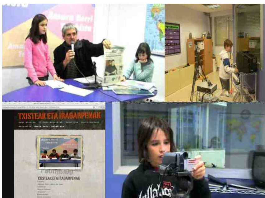
Imagen 3. La televisión de Amara Berri

Este taller tiene dos espacios bien definidos, por un lado, el plató de televisión y por otro el espacio de edición de vídeo. El espacio del plató de televisión cuenta con un panel donde aparece el nombre del canal de televisión: Amara Berri Telebista. Aquí se realizan las grabaciones de programas. Cuenta con una infraestructura tecnológica básica donde podemos encontrar, entre otros recursos, la cámara de vídeo, trípode, micros, monitor, magnetoscopio para proyectar vídeos analógicos, etc. También cuenta con diferentes ropajes, telas, sombreros que se utilizan para disfrazarse en las dramatizaciones que graban los alumnos. La actividad del taller de televisión es muy variada, como se puede observar en la Imagen 3, donde podemos ver a los alumnos en las diferentes fases de grabación y edición. También observamos la escena del