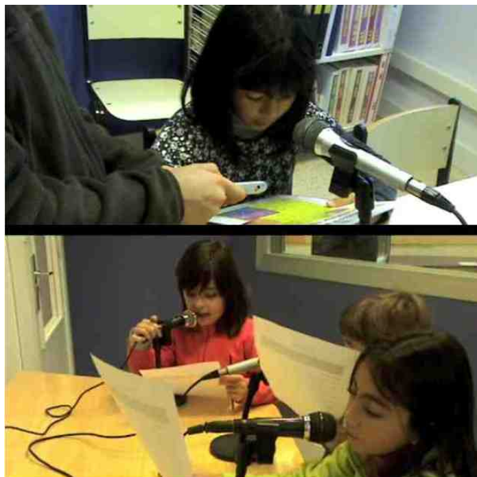
Imagen 4. La radio de Amara Berri

Amara Berri Irratia/Radio Amara Berri, se emite en la frecuencia 107.2 en abierto para todo el barrio de Amara y Centro, donde están enclavadas las sedes de la Escuela. En la Imagen 4 aparece en la parte superior, una escena donde un alumno graba con un podcast a una alumna leyendo un cuento. En la parte inferior alumnos del segundo ciclo grabando un informativo que habían preparado.